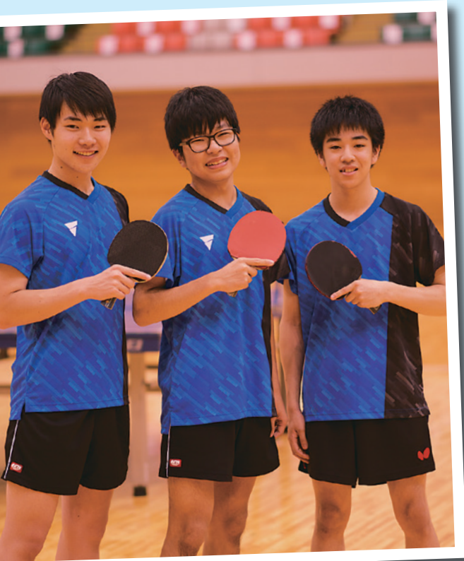
Table Tennis 卓球部

神奈川県の高校で卓球部の顧問を務めておりましたが、ご縁がありまして本校に着任し、今年で2年目となりました。私も卓球部も、まだまだ発展途上です。県の上位を目指すことも目標として大事なことです。それ以上に「卓球をがんばりたい生徒が選ぶような部にしたい」と考えています。「一生懸命練習したから勝てた!」というような成功体験を、生徒と一緒に重ねていきたいです。