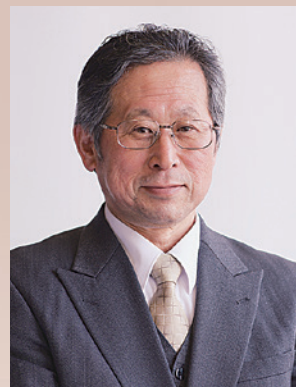
学校法人一関学院 一関学院高等学校